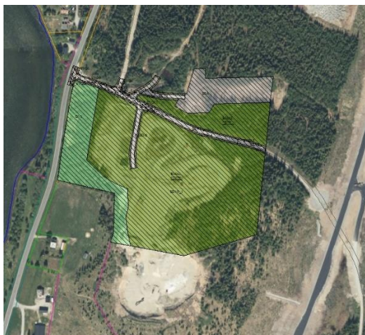
Figur 1: Kartutsnitt plankart.

Planområdet grenser i sør mot ytterligere arealer av masseuttak samt innmark, og i nord og øst mot skog og utmark og i vest grenser planområdet til gamle E6, innmark, skog og myrområder. Nærområdet består hovedsakelig av landbruksområder, skogsområder, masseuttak, veg og Svenningelva.